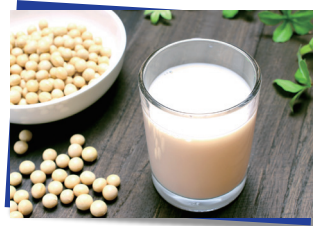
自社アイテムの撮影