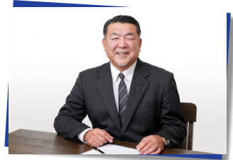
代表からの啓発動画配信