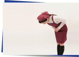
スタッフ教育用動画撮影